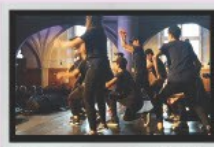
ANGEBOT FÜR KIRCHGEMEINDEN

Ob live im Tonstudio des Hiphop Centers oder als Workshop - die Teilnehmenden werden in die Welt des Raps entführt und haben die Chance einen eigenen Song zu schreiben!