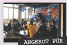
ANGEBOT FÜR SCHULEN

Im Rahmen von Graffitiworkshops lernen die Kids die Basics der Graffiti-technik und des Spray-ens und erarbeiten gemeinsam als Produkt ein Graffiti-kunstwerk.