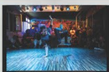
BREAKDANCE & HIPHOP

Durch Workshops haben die Kinder und Teenager die Möglichkeit, die Basics im Breakdance und Hiphop zu erlernen und eine aufführungsreife Choreografie zu erarbeiten.